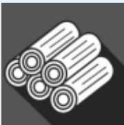
ASERRADEROS Y MADERERAS