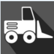
MOVIMIENTO DE TIERRA