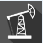
PETRÓLEO Y GAS