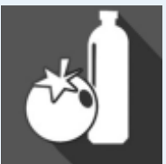
ALIMENTOS Y BEBIDAS