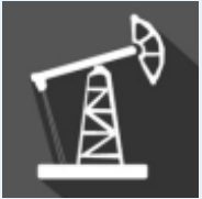
PETRÓLEO Y GAS