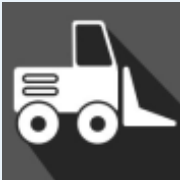
MOVIMIENTO DE TIERRA