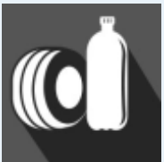
CAUCHO Y PLÁSTICOS